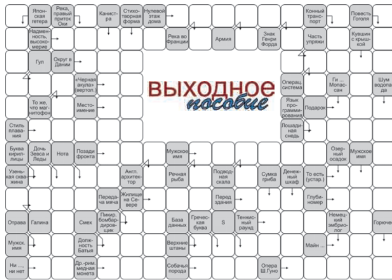
Ответы на сканворд, опубликованный в №№59-60 от 24.07.2014

- У тебя что - жена блондинка? - А как ты догадался? - Вот, тебе телеграмма пришла, я нечаянно вскрыл. "Отпуск кончается. Завтра буду дома. Подробности письмом."