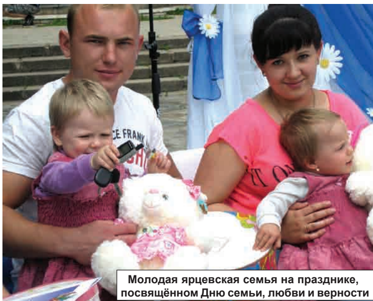
Молодая ярцевская семья на празднике, посвящённом Дню семьи, любви и верности

ставило 144% — это самый высокий показатель за последние десять лет. Отмечу также, что на протяжении последних пяти лет разводы составляли от 75% до 83% от количества всех заключённых браков.